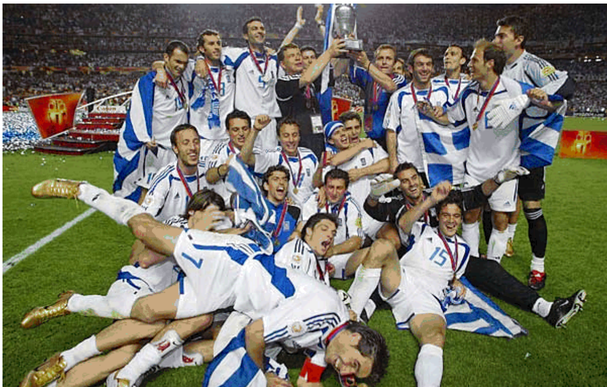
Underdog: Bei der EM 2004 in Portugal gewann Griechenland die Europameisterschaft.

Hat Christoph Metzeldernach seiner Verletzung schon wieder die Fitness und Schnelligkeit mit den besten Stürmern der Welt mitzuhalten? Und können Miroslav Klose und Lukas Podolski ihre Formkrisen aus der Bundesliga bei der EM überwinden? Wahrscheinlich werden wir diese Zweifel erst in den Spielen ausräumen können, wünschen tun wir uns natürlich alle, dass alle Fragezeichen mit einer stabilen Form die deutsche Mannschaft bereichern. Auch wenn wir vielleicht taktisch mit den besten Teams aus Italien, den Niederlanden und Portugal nicht mithalten können, muss das deutsche Team eben durch Einsatz, Laufbereitschaft und Spielwitz überzeugen. Dass